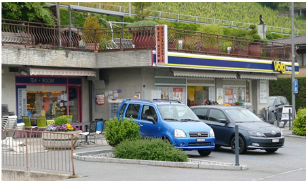
Le local est idéalement situé à côté du magasin Volg et de notre guichet d'accueil communal

La Commune de Noble-Contrée a dès lors entamé des discussions avec le propriétaire en vue du rachat de ce local commercial, dans l'objectif qu'une nouvelle enseigne y soit intégrée au plus vite. Cette acquisition a été actée en janvier dernier.